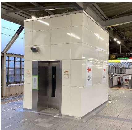
改札内エレベーター (東海道本線下りホーム)