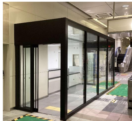
ウォークイン改札