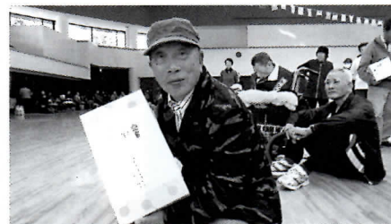
こちらも一等賞!!にっこり