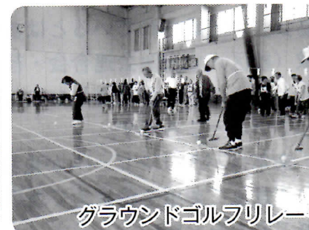
グラウンドゴルフリレー