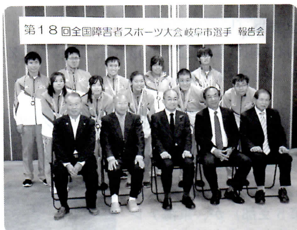
第18回全国障害者スポーツ大会岐阜市選手報告会