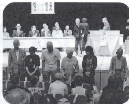
援護功労受賞者の皆さん