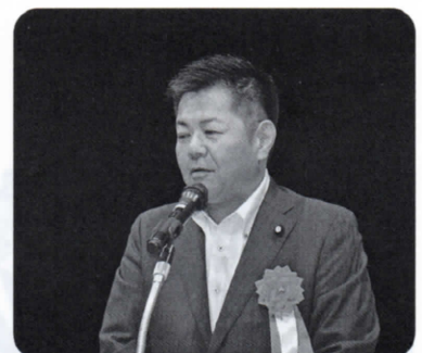
祝辞 渡辺参議院議員