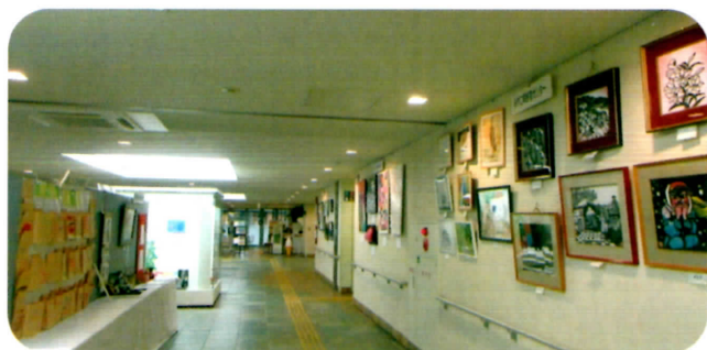
ハートフルスクエアG内展示会場