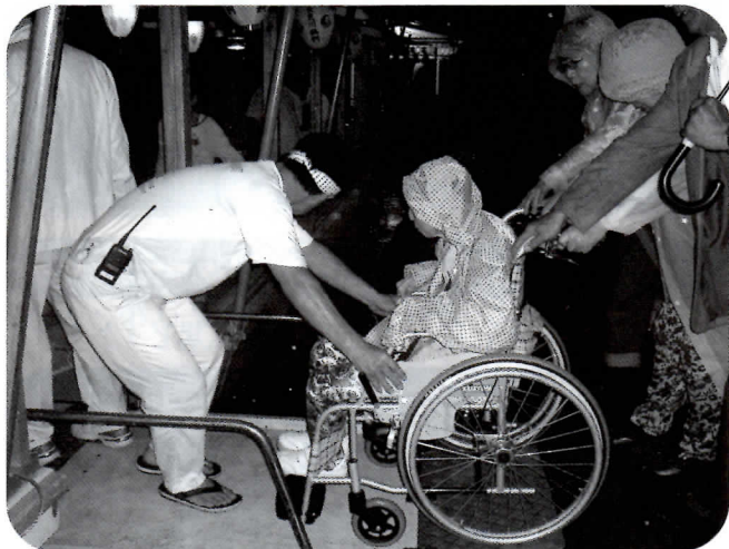
▼鵜舟の中まで車いすで