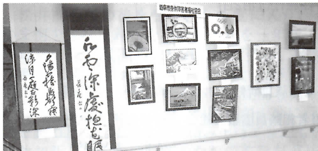
河合 庵・栗山克己・一柳正和・大塚和彦 田中義正