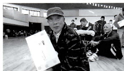
こちらも一等賞!!にっこり