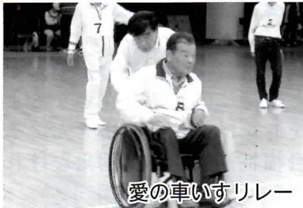
愛の車いすリレー