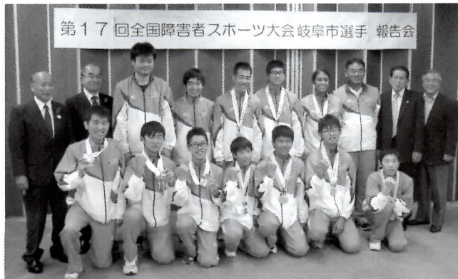
第17回全国障害者スポーツ大会岐阜市選手 報告会