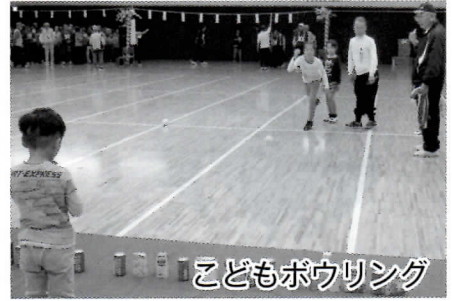
こどもボウリング