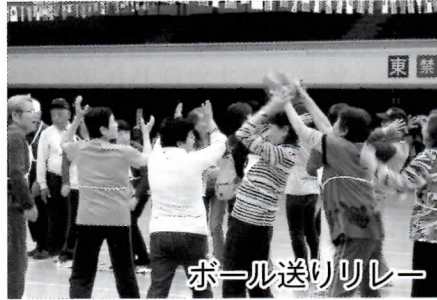
ボール送りリレー