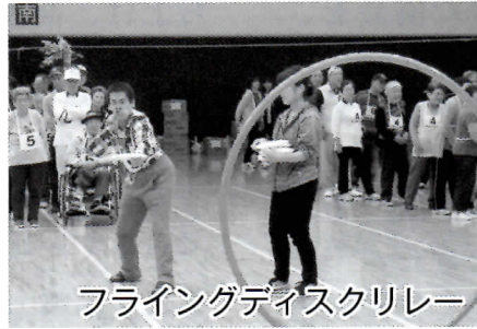
フライングディスクリレー