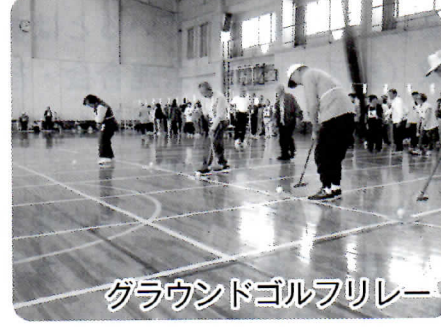
グラウンドゴルフリレー