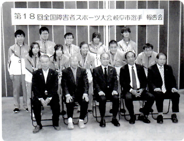
第18回全国障害者スポーツ大会岐阜市選手 報告会