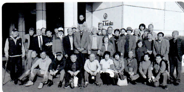
函南町・かんなみ桜まつりと東伊豆 伊東温泉